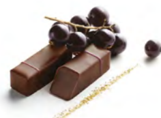
NOIR DE CASSIS

Ganache au chocolat noir à la pulpe de fruit de la passion.