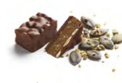
PRALINÉ GRAINE DE COURGE

Praliné pécan aux éclats de noix de pécan caramélisées.