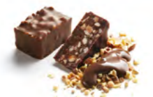
ROCHER NOIR & LAIT

Praliné amandes-noisettes aux éclats de crêpes dentelle.